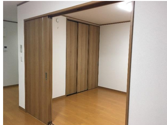
洋間 7.5 帖