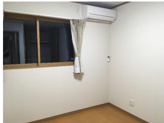
洋間 5.5 帖