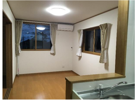
LDK 約 11 帖