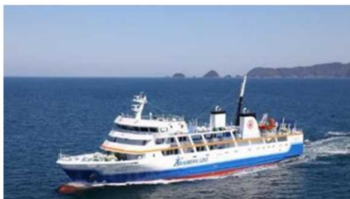
普通船フェリー ニューあわしま