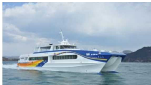
高速双胴船 awaline きらら