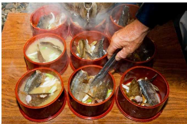
粟島名物 わっぱ煮